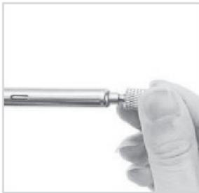
Futterhalter mit Futter in die Spitze des LötKolbens stecken