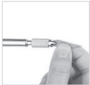
Messer in die Öffnung im Futter geben